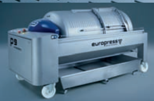
Design esthétique de l'Europress