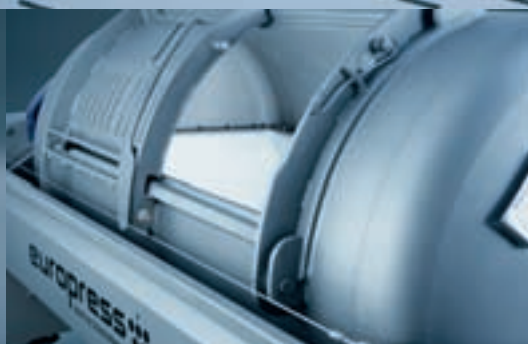
Ouverture de porte